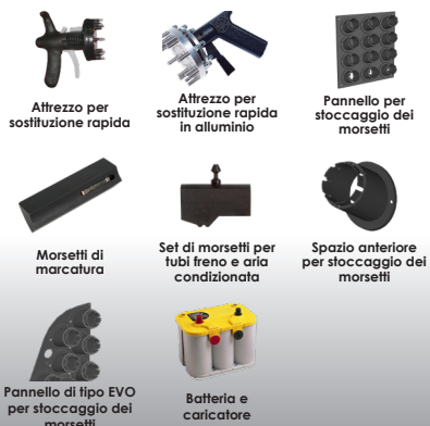
Attrezzo per sostituzione rapida