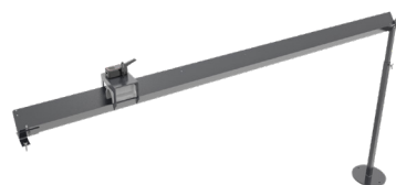
Rail de coupe