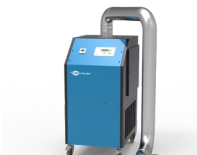
Extractor de humo