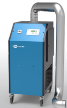
Extractor de humo