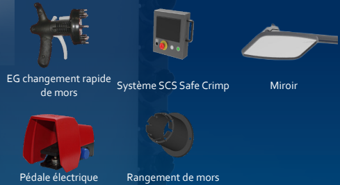
EG changement rapide de mors