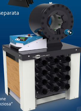
Versione di produzione con unità centrale "silenziosa"