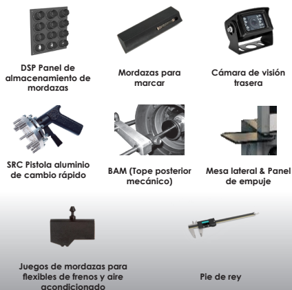
DSP Panel de almacenamiento de mordazas