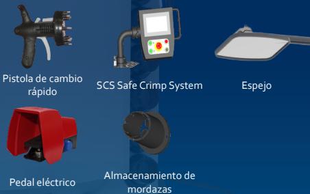
Pistola de cambio rápido