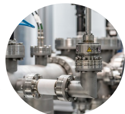
Öl und Gas