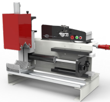
S PUSH 2000