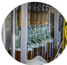
Agrar- und Ernährungswirtschaft