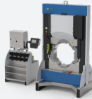
XL CRIMP 550-16