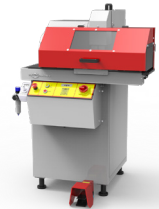
S CUT 75 P

Kapazität : 2" 6WS Schlauch-OD max : 125 mm Motor : 7.5 kW