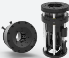
Autocrimp 108/158 Pro V