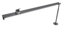
Binario di taglio